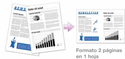
Formato 2 páginas en 1 hoja

La DX 4542 ofrece una alta calidad y versatilidad a un precio sorprendentemente económico. Su avanzado sistema de alta calidad proporciona una impresión precisa y detallada, combinando una mayor calidad de imagen con un bajo coste total de operación. Para la impresión diaria, ofrece un modo de impresión económica que reduce el gasto en tinta hasta un 15%, y su formato 2 en 1 ahorra tiempo y papel, permitiendo combinar las distintas páginas en un solo documento. Con los códigos de usuario se asignan costes a los usuarios internos y externos, facilitando el control de los gastos. Todo está diseñado para asegurar una impresión y una administración de la más alta calidad, con la capacidad de reducir el coste por página y asegurar el máximo nivel de ahorro.