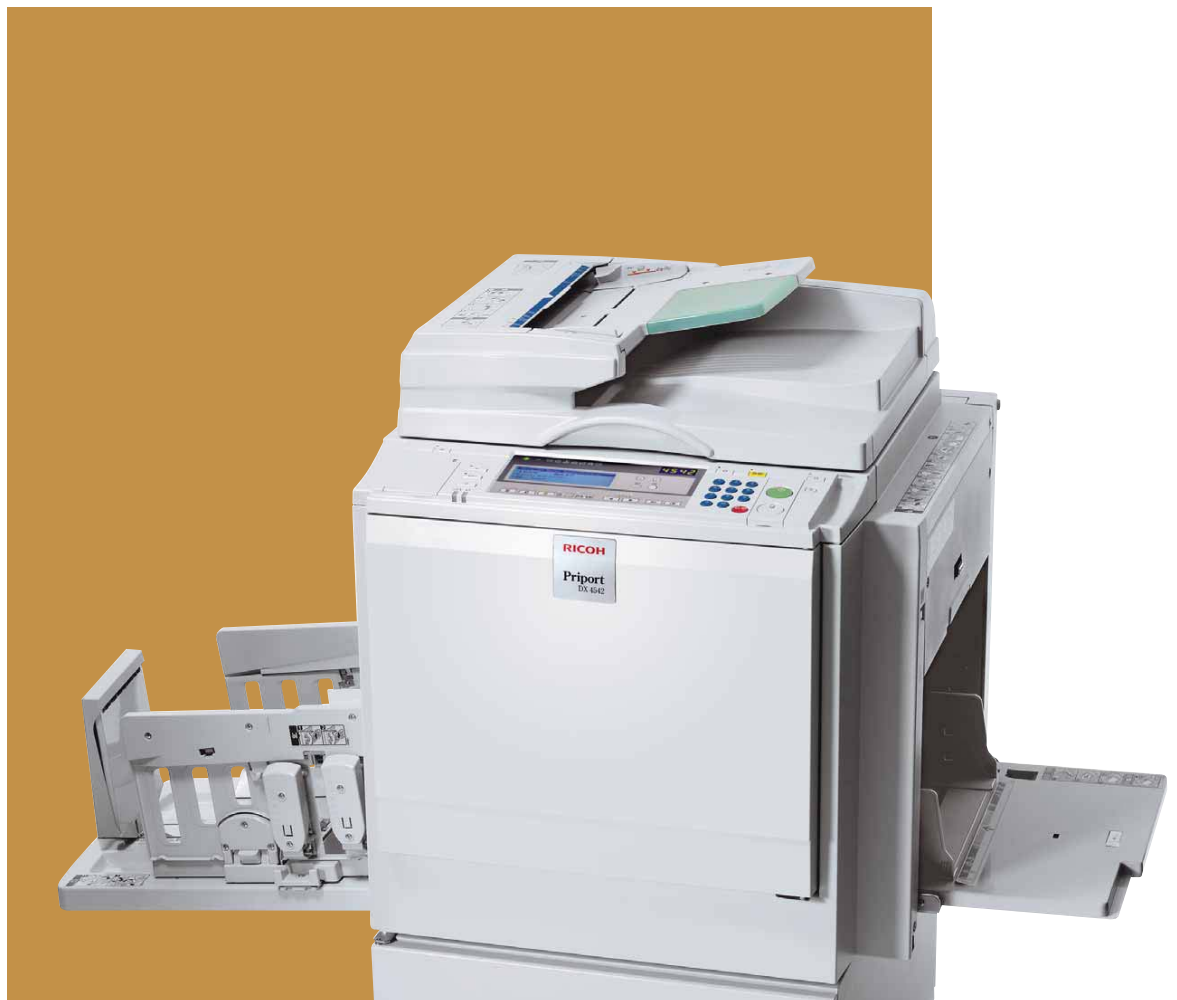
Priort™ DX 4542

Una priport para alcanzar nuevos niveles de calidad y ahorro